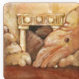
avec entrée dans la grotte